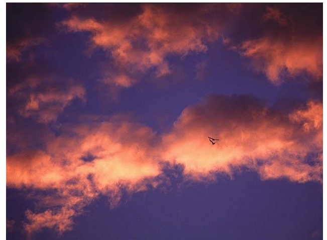
Cumulus- oder Haufenwolken

Die Cirruswolken bestehen aus kleinen Feldern und Streifen, die sich langsam über den gesamten Himmel ausbreiten. Die Wolken scheinen Richtung Horizont strahlenförmig zusammen zu laufen. Sie zeigen eine sich von Westen nähernde Warmfront an.